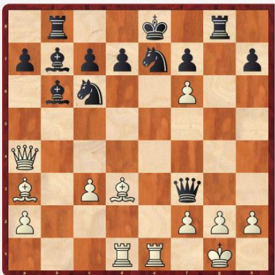
Diagram 1: Bílý na tahu vyhraje

Tuto hrozbu černý ještě pokryl tahem 3...Je5, ale přišlo 4.Df6 Vh7 a nyní pěkné zavlečení krále obětí věže 5.Ve8+ Kxe8. Černý král zadržený v centru tak neunikl svému konci po 6.Dd8 mat.