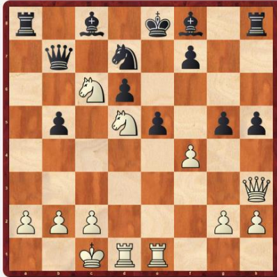
Diagram 2: Bílý na tahu vyhraje

Také v další ukázce udělá bílý rychlou přepadovou akci, při které na soupeřova krále otevře sloupce. Začne dobře spočítanou obětí věže 1.Vxe5+ . Černý ji nemůže přijmout 1...dxe5 pro 2.Jf6+ Jxf6 a 3.Vd8 mat).