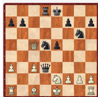
Diagram 3: Černý na tahu vyhraje

https://my-chess.com/sachopedie/article/572