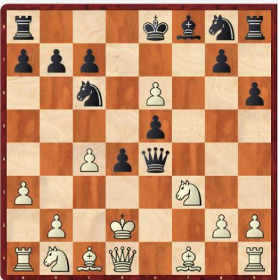
Diagram 4: Černý na tahu vyhraje

Po 2...Kxd7 3.Sf5+ Ke8 4.Sd7+ Kf8 dá bílý 5.Sxe7 mat.